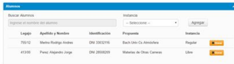
Imagen 3: Carga de estudiantes al acta

Una vez finalizada la carga de todos los estudiantes, pulse el botón ubicado en el margen superior derecho Guardar .